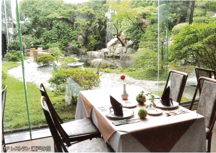
1F レストラン 瀬戸の花