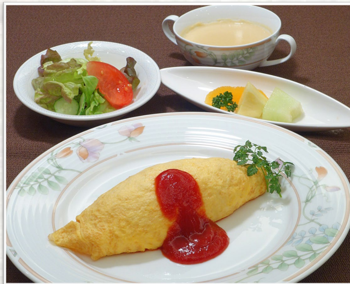
オムライスセット