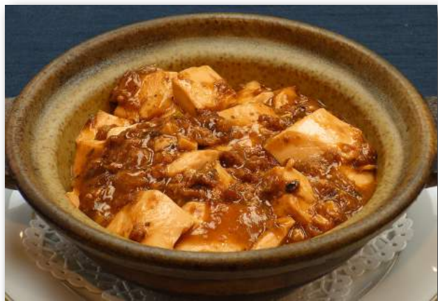
麻婆豆腐 (土鍋) 1,210円