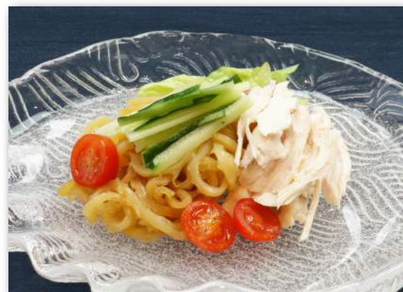
クラゲ蒸し鶏中華和え 880円