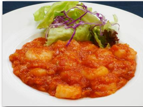
海老のチリソース煮 1,540円