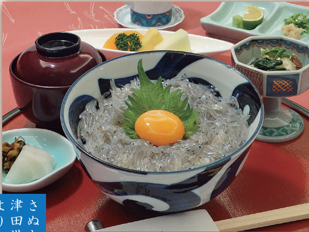
(天麩羅・うどん・小鉢・香の物・フルーツ付き) 1,540 円