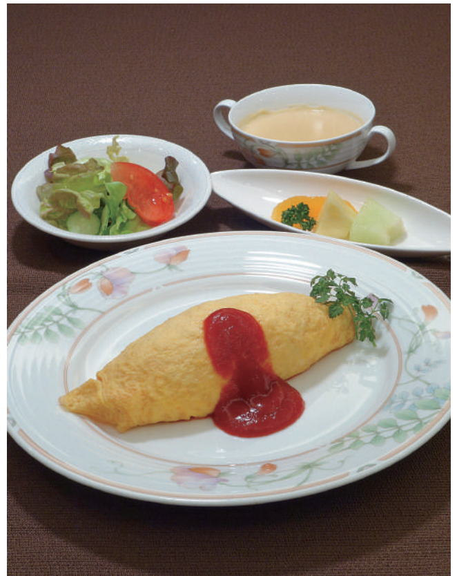
オムライスセット (スープ・サラダ・フルーツ付き) 1,650円