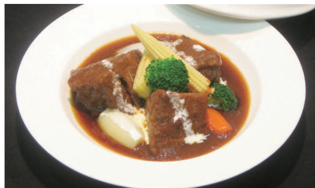
牛ホホ肉のラグー 1,760円