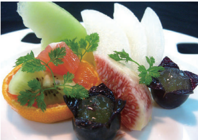
旬のフルーツ盛り合わせ 1,100円