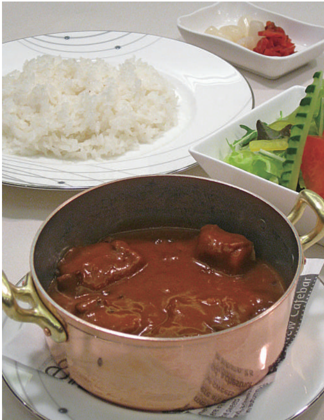
ビーフカレーセット (スープ・サラダ・フルーツ付き) 1,650円