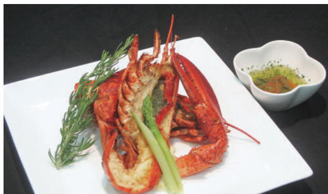
オマールエビのポワレ 焦がしバターソース 3,300円