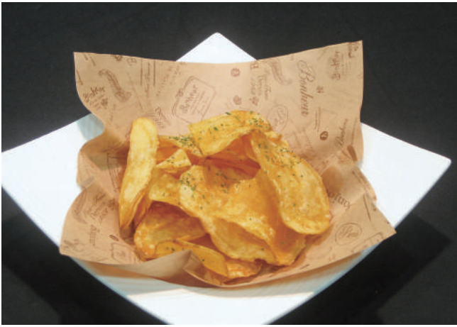
厚切りポテトフライ 660円