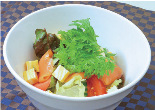
スモークサーモンとチーズのサラダ 770円