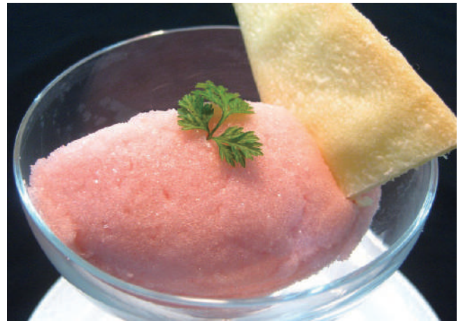
ソルベorアイスクリーム 440円