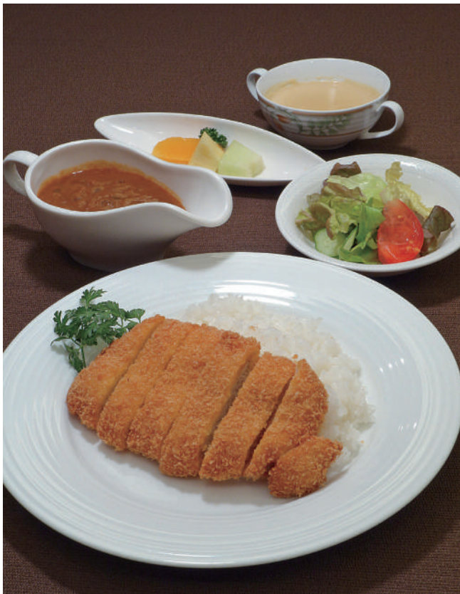
カツカレーセット (スープ・サラダ・フルーツ付き) 1,870円