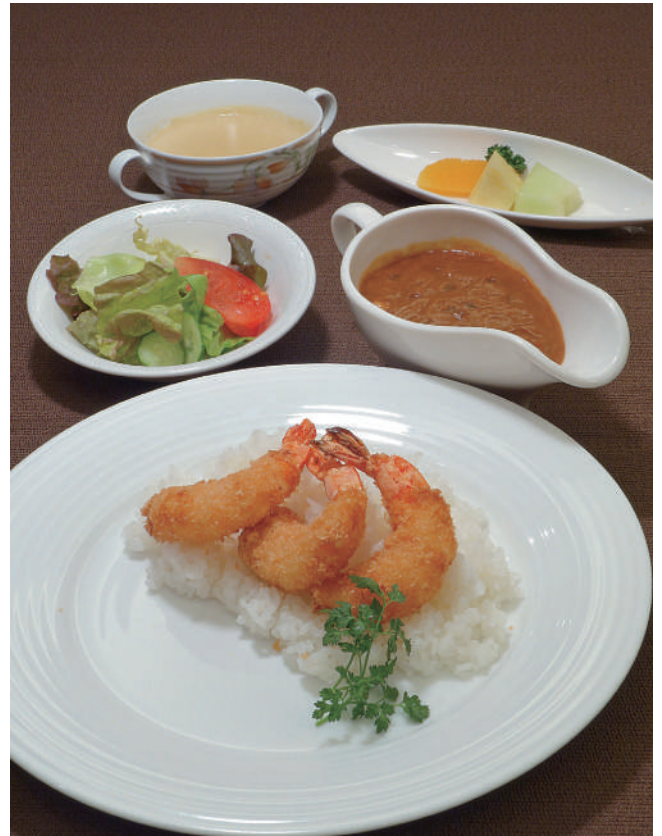
海老フライカレーセット (スープ・サラダ・フルーツ付き) 1,870円