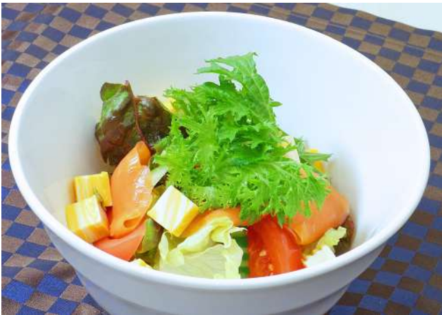
スモークサーモンとチーズのサラダ 700円