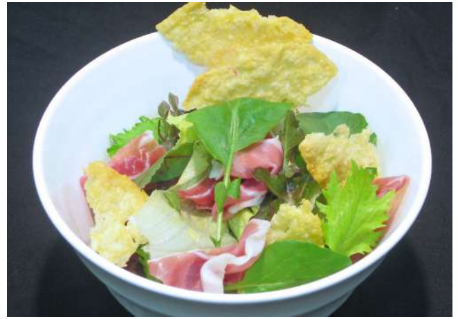
カリカリチーズと生ハムサラダ 700円