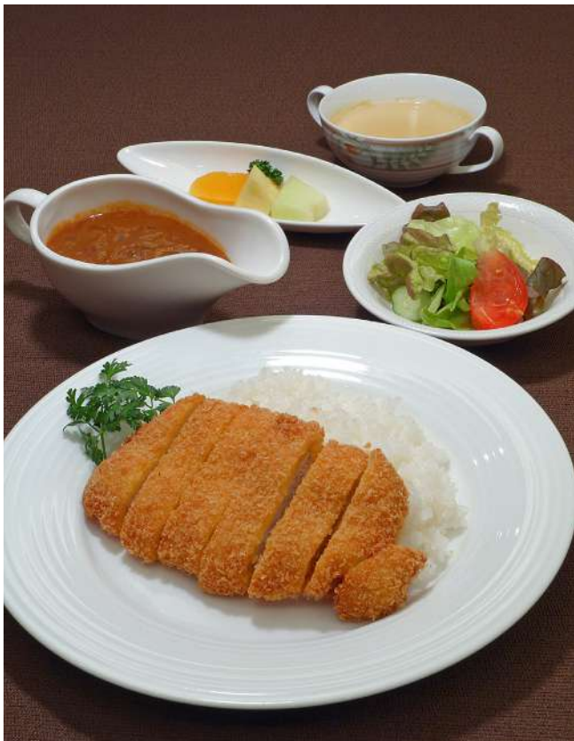
カツカレーセット (スープ・サラダ・フルーツ付き) 1,600円