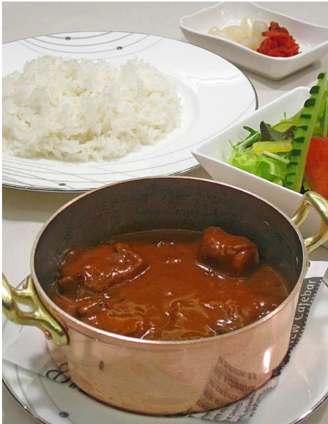
ビーフカレーセット (スープ・サラダ・フルーツ付き) 1,400円