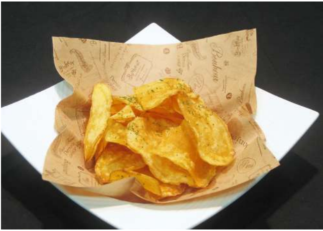
厚切りポテトフライ 600円