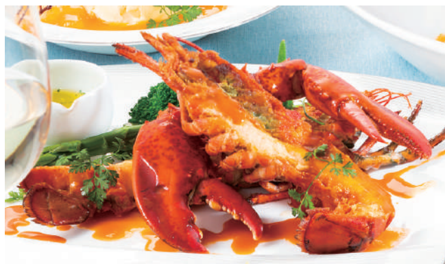
オマールエビのポワレ 焦がしバターソース 2,300円