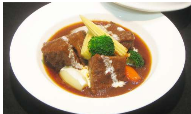
牛ホホ肉のラグー 1,400円