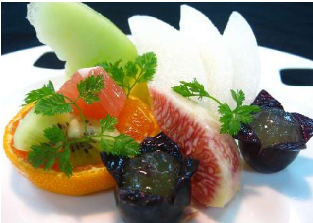
旬のフルーツ盛り合わせ 700円