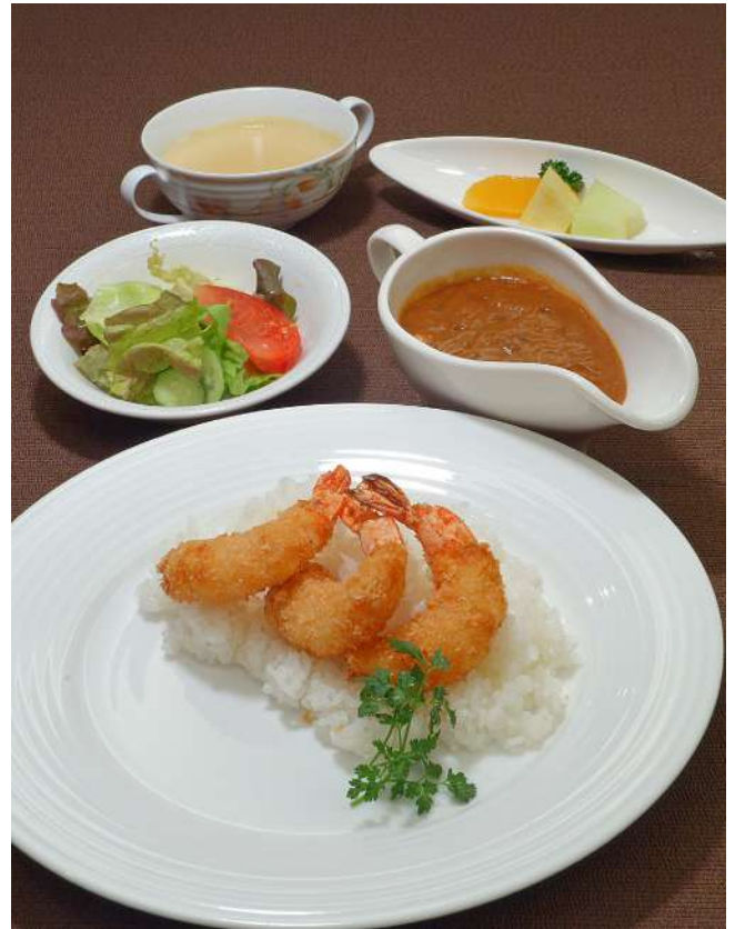
海老フライカレーセット (スープ・サラダ・フルーツ付き) 1,600円