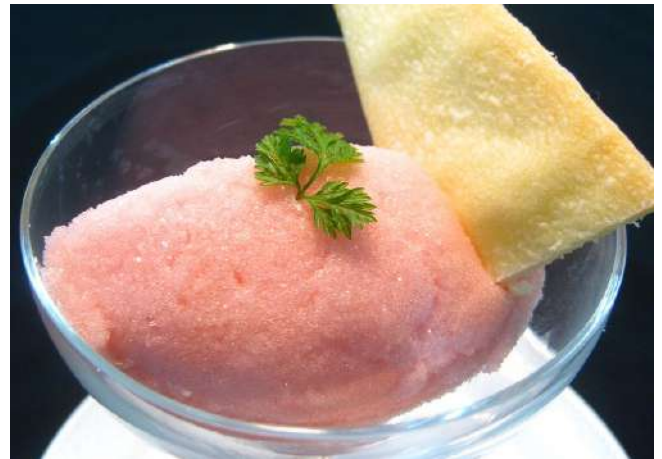
ソルベorアイスクリーム 400円