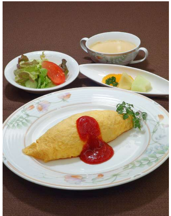
オムライスセット (スープ・サラダ・フルーツ付き) 1,300円