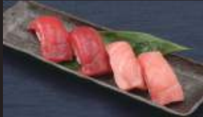
生本鮭赤身&中トロ (各2貫) 1,100円