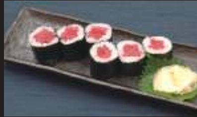
生本鮭鉄火巻 (1本) 660円