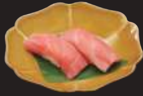
生本鮭中トロ (2貫) 715円