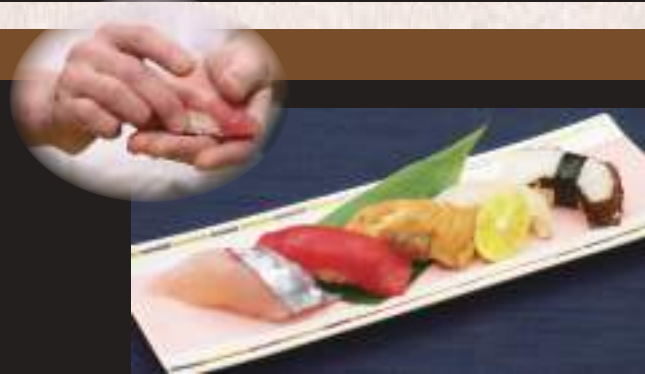
瀬戸内地魚と生本鮭の 盛り合わせ (5貫) 1,430円