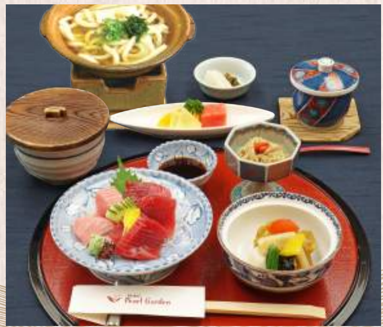
生本鮭お造り膳 生本鮭お造り、焚合せ、茶碗蒸し、うどん、小鉢、ご飯、香の物、フルーツ 2,310円