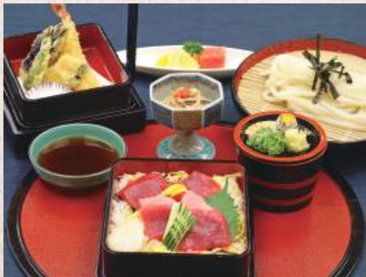
生本鮭ちらし膳 生本鮭ちらし、天婦羅、ざるうどん、小鉢、フルーツ 2,310円