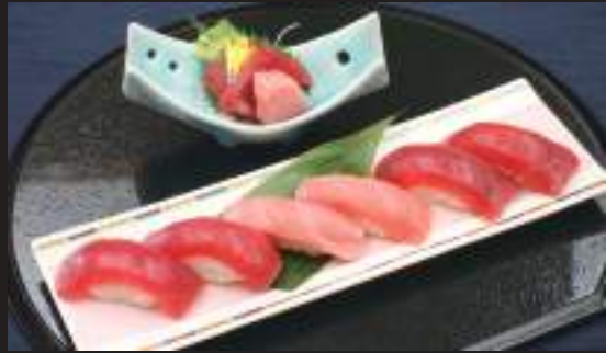
生本鮭いろいろ6貫握り&造り 1,870円