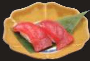
生本鮭赤身 (2貫) 440円